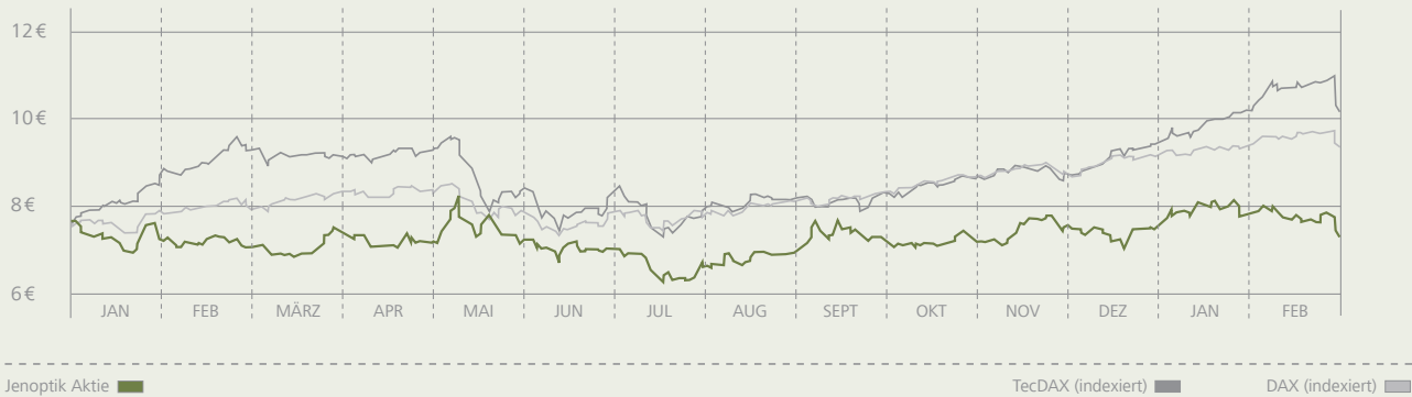
Die Kursentwicklung der Jenoptik-Aktie (2. Januar 2006 bis 28. Februar 2007)