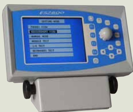
Module principal : version horizontale avec support pivotant