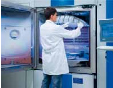
Bestückung der Hochvakuumbedampfungsanlage SYRUSpro